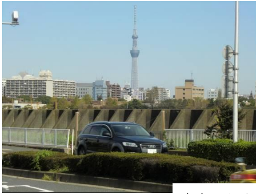
東京スカイツリー